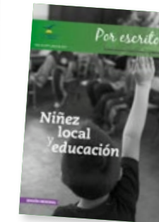
Revista Por Escrito 11: Niñez local y educación Infância local e educação