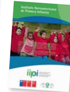
SIPI Chile SIPI Chile