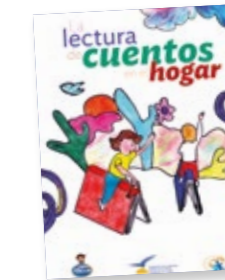
La lectura de cuentos en el hogar A leitura de histórias em casa