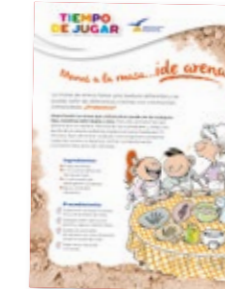
Tiempo de Jugar Tempo de brincar