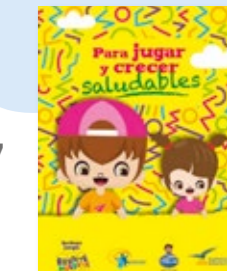
Para jugar y crecer saludables Para brincar e crescer saudável