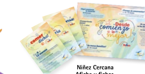
Niñez Cercana Afiche y fichas Cartaz e Pôster