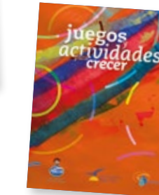
Juegos y Actividades para crecer Brincadeiras e Atividades para crescer